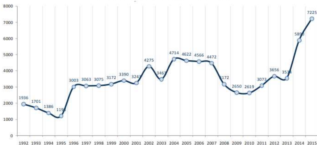
Série anual de roubo de carga – 1992 a 2015