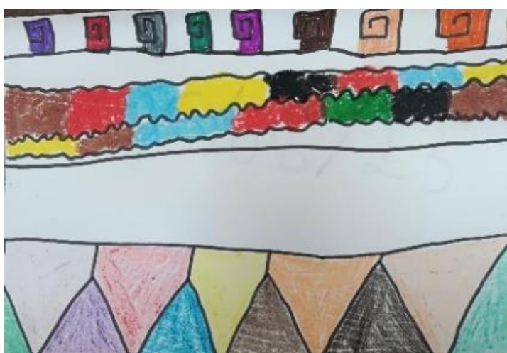
Figura 8, Cores