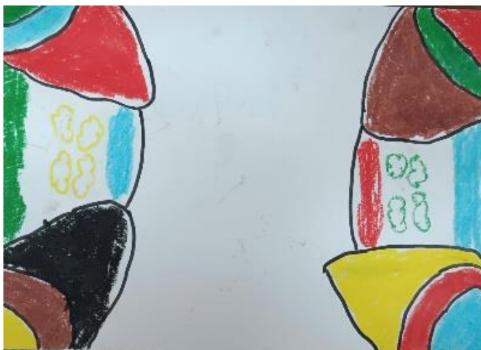
Figura 7, Montanhas felizes

analisando que tinha complexo com seu cabelo, hoje se aceita, das dificuldades, encontrou uma solução, de um desenho trouxe a fala.