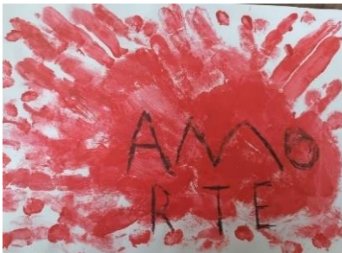
Figura 5, amo arte, a morte