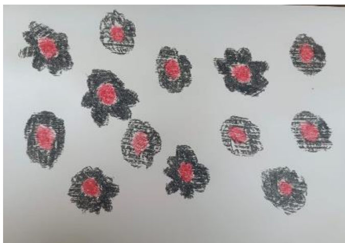
Figura 4- Flores

Já na próxima sessão, a queixa era do julgamento da sociedade para com o seu cabelo, corpo e vestimentas. O analisando, desenhou algumas flores, as ilustrações prevaleciam tom de vermelho e preto.