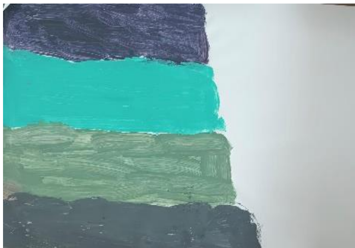
Figura 1 – Listras

escolher, de sua maneira como iria se comunicar, dessa forma, deu início a um desenho (figura 1), começou a falar que não gostava de chorar e de expor os seus sentimentos e que guardava tudo para si, predomina em seu desenho as cores em tom de azul e verde.