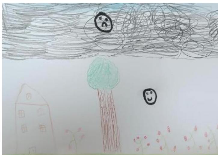
Figura 6, Feliz e triste

As ilustrações começaram a ter um novo sentido para a paciente (figura 6).